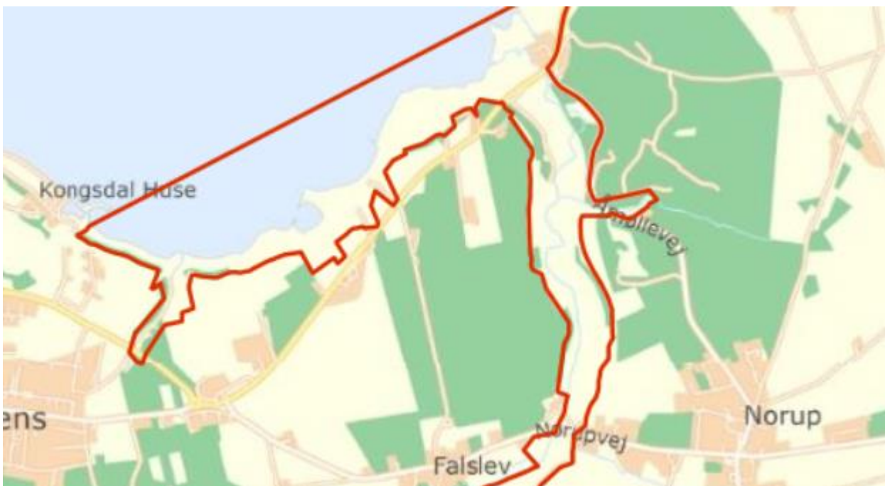
Figur 2 Delområde 2 mellem Mariagervej og Norupvej