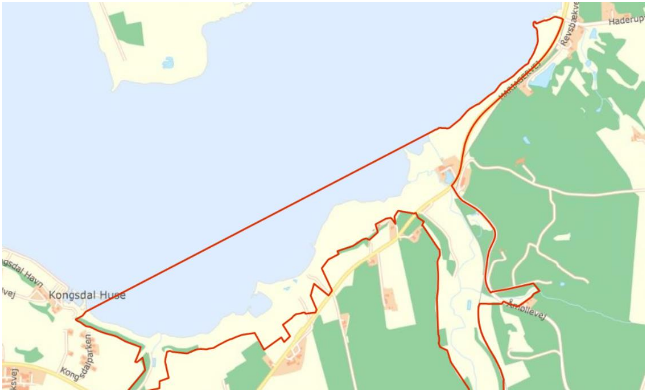
Figur 1 Delområde 1 nord for Mariagervej