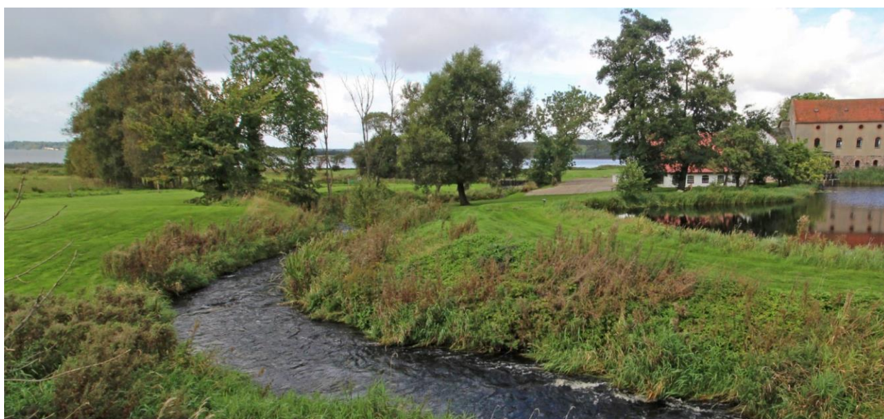
Kastbjerg Å ved Åmølle

Oplysninger i denne rapport afspejler kun forfatterens holdning. EU Kommissionen er ikke ansvarlig for nogen brug af disse oplysninger.