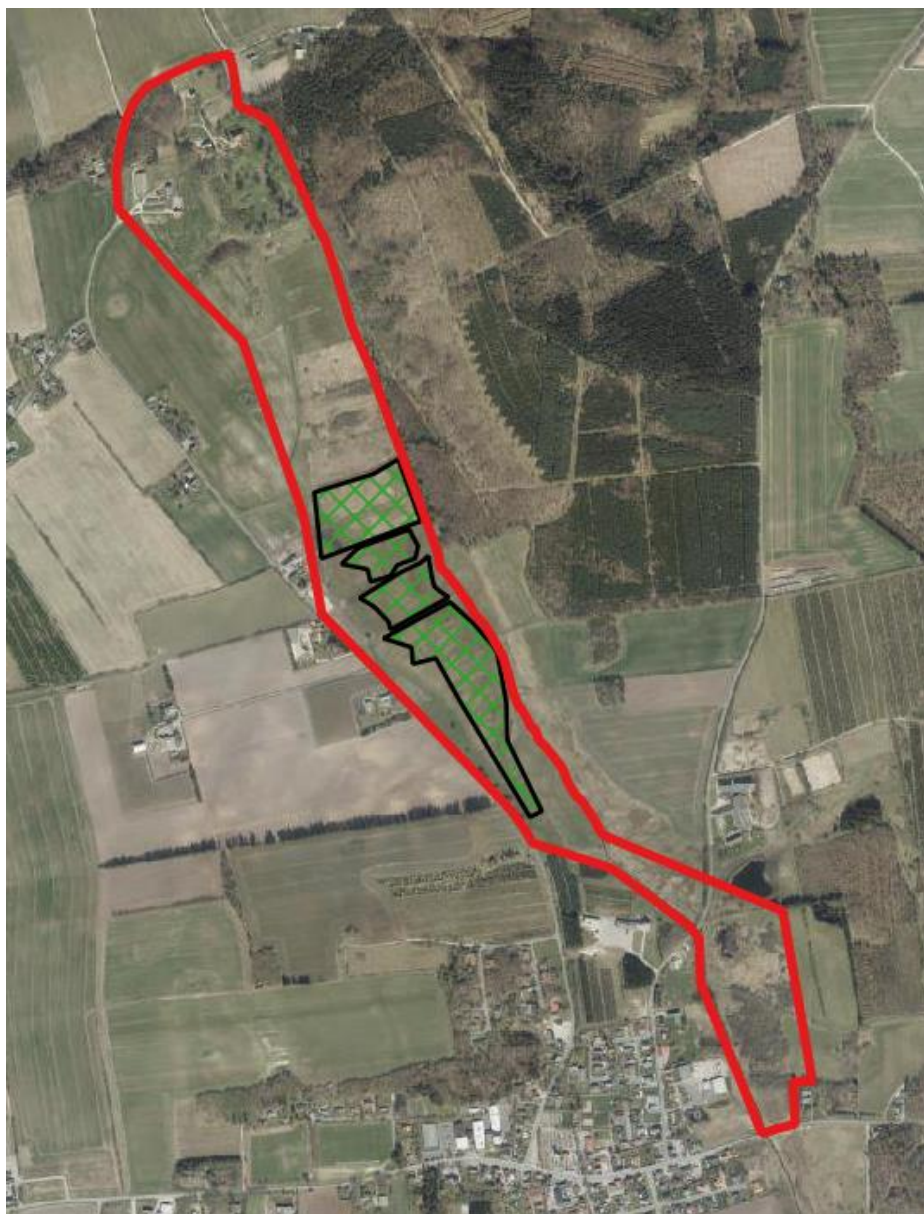
Figur 1: N15_6 Skrædderengen med centrale habitatregistrerede rigkær

Visionsrapporten for N15-6 Skrædderengen er en forløber for mulighedskataloget og beskriver området, inklusive mulige tiltag i henhold til formålet med LIFE IP Natureman projektet (figur 1). Fokus er i særlig grad på etablering af større hegningsenheder om muligt kombineret med genskabelse af naturlig hydrologi gennem lukning af grøfter. Herved skabes grundlaget for en øgning af arealet og opretholdelsen af sammenhængen især mellem rigkærene i området. Om muligt inddrages overdrev samt arealer i om drift med overdrevspotentiale.