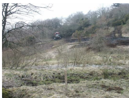
Rydning af tæt krat af slåen, brombær, roser m.v. som flere års græsning ikke kunne klare

Der er i årene efter den flerårige "førstegangsydning" hvert år blevet foretaget en supplerende maskinel rydning af brombærkrat og genvækst, men i et omfang langt mindre end hvis der på arealet var blevet førstegangsyddet maskinelt fra en ende af, og så derefter havde sat græsning på.