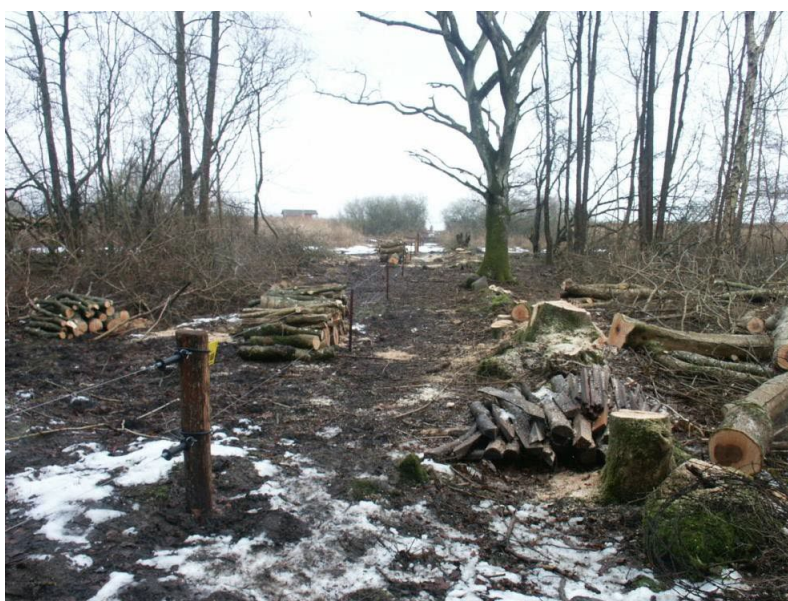
Rydning af hegnslinje og opsætning af hegn

Inden hegnssætningen skal den valgte hegnslinje ryddes for generende opvækst. Alt efter det grej der anvendes til at sætte hegnet med vil en rydningsbredde på 2 – 3 meter være tilstrækkeligt.