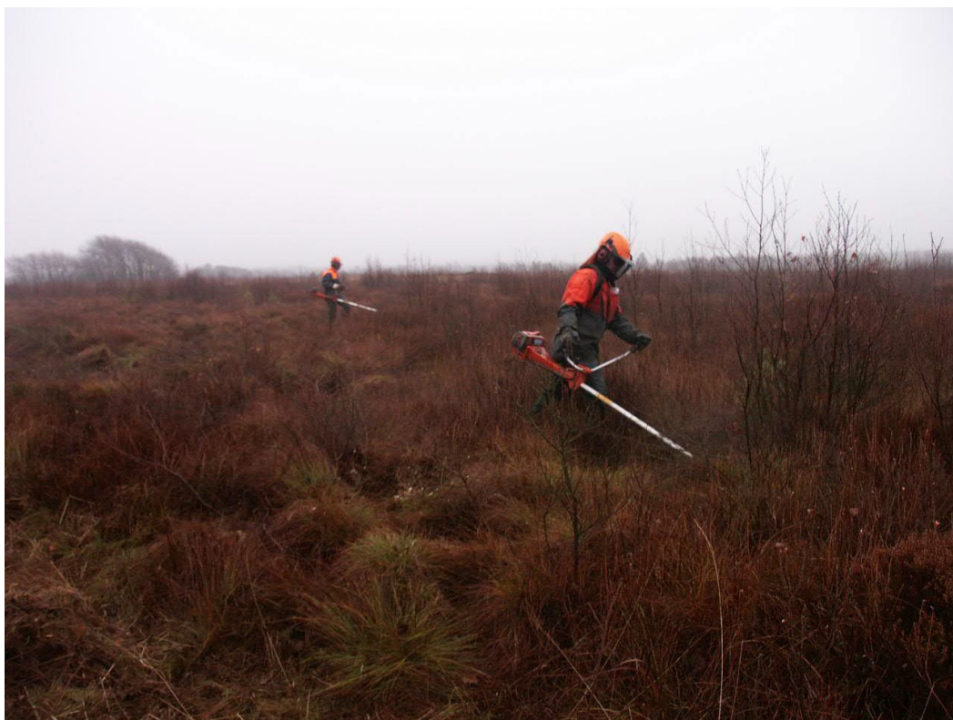
Her foretages rydning i en mose som ikke kunne følges op, og derfor var nytteløs.

Ved lidt større opgaver kan denne ” Start med rydning” metode også være farlig at praktisere da enten ejeren af arealet og/eller det politiske bagland forskrækkende hurtigt kan ændre indstilling til projektets færdiggørelse, hvilket let kan afstedkomme at arealet bliver forladt mere eller mindre færdigryddet, og uden mulighed for at følge op med hverken hegning/græsning eller anden pleje. Det lyder lidt skørt, men er i praksis set alt for tit. Også her er det almindeligt at tilstanden er blevet værre end før indgrebet.