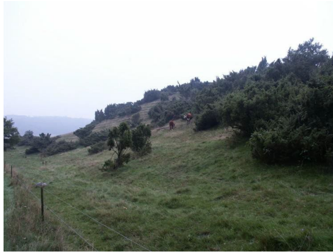
Eksempel på græsning før rydning

Denne rapport belyser fordele og ulemper ved græsning før rydning