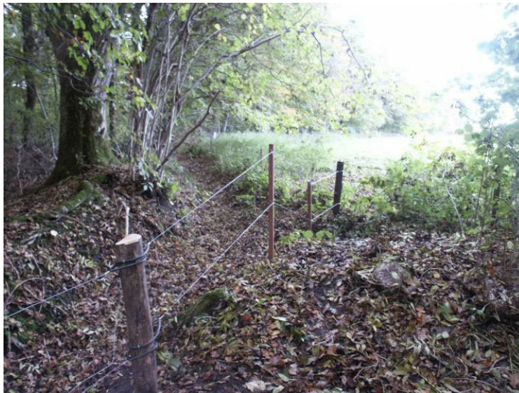
Eksempel på hegn i kuperet terræn

Herefter kan det valgte hegn sættes, og dyrene sættes ind på arealet og plejen kan begynde.