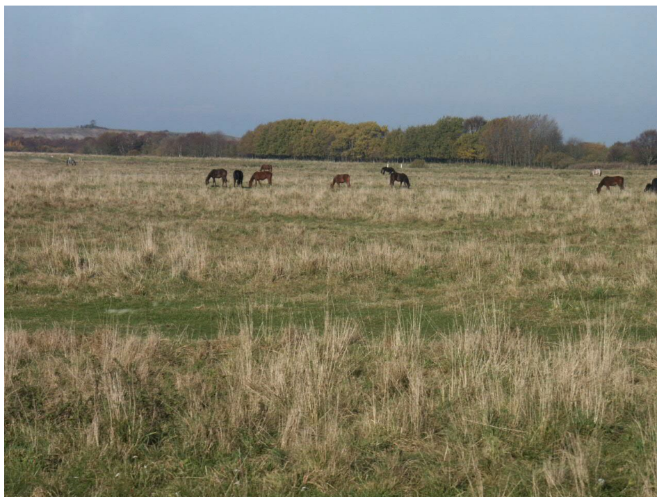
Engareal med vedvarende græs som drift af et naturareal

Med mindre der er tale om særlige forhold er der som planlægger af naturpleje ikke nogen grund til at risikere at anvende "Start med rydning" metoden frem for "Start med græsning" metoden.