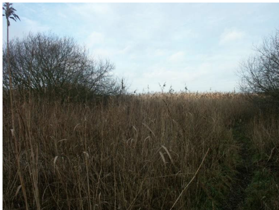
Engareal med tagrør, pil og rødel inden græsningen kan erkendes

Opgaven var at få en del af strandengene i Amstrup Enge tilbage til græsset strandeng. I alt ca. 30 ha. Efter mange år med svigtende interesse for at græsse engene, var store dele tilgroet med tagrør, og der var efterhånden groet en hel del rødel ind fra siderne, samt spredt opvækst af bl.a. pil.