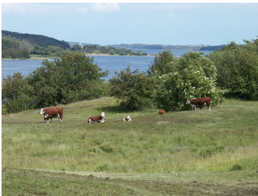
Overdrevsareal med græsning før rydning

En mose under tilgroning, hvor tilgroningen ønskes fjernet helt eller delvist, er ofte en opgave der stiller store krav. Mange gange ønskes tilgroningen standset og træer og buske fjernet. Her kan der eksempelvis startes med at sætte hegn og græsning på arealet. Hvis der er en tæt vegetation kan der startes med at sætte får på det/ de første år. Derefter kan der foretages den nødvendige rydning og følges op med græsning med geder der er meget velegnede til at spise opvækst af træer og buske. Geder har ydermere den fordel at de ikke opholder sig på fugtig eller våd jordbund mere end den tid det tager at spise genvæksten. Det har positiv betydning for den våde del af mosen, at dyrene færdes mindst muligt. Rydning af træer og buske foretages bedst ved at bruge den metode, hvor der ikke køres direkte på mosen. Se eksemplerne Gallemosen og Allestrupgård.